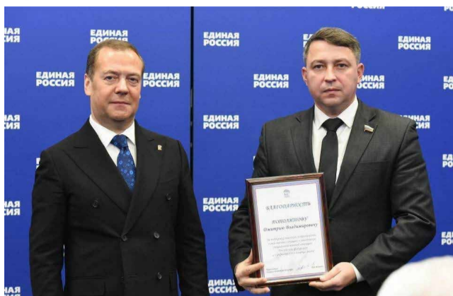
Окончание. Начало на 1-й странице.

Это награда вручена атаману за активную помощь жителям Донбасса и военнослужащим, участвующим в специальной военной операции на Украине.