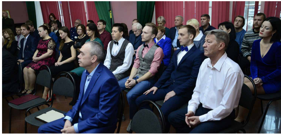
Таланты и поклонники.

карточкой театра. Этот спектакль точно отражает сегодняшнюю обстановку в нашей стране и заставляет людей задуматься о важных вещах в жизни каждого человека. По решению коллектива денежные средства от продажи билетов на этот спектакль будут перечислены в Фонд поддержки военнослужащих и добровольцев, участвующих в специальной военной операции.