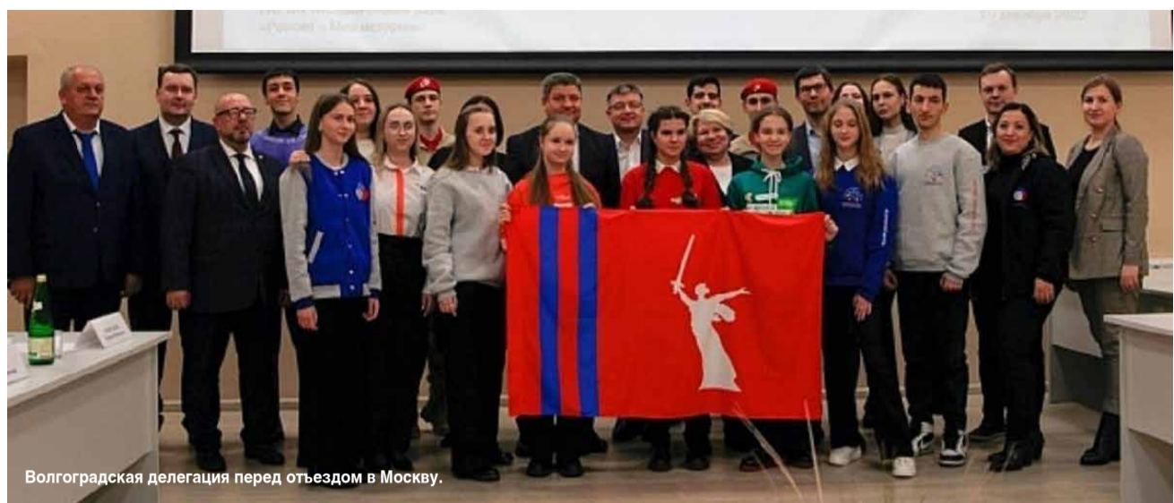
Волгоградская делегация перед отъездом в Москву.