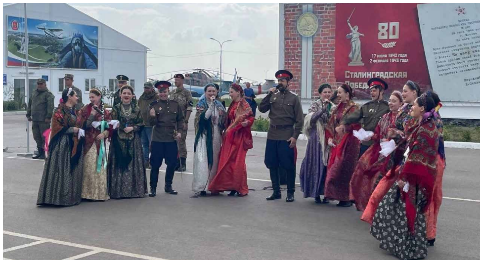
Участников сборов приехал поддержать народный фольклорный этнографический ансамбль «Покров»

В Волгоградской области стартовал новый сезон военно-спортивных сборов «Авангард». Первая смена из 50 школьников прошла с 12 по 18 мая в Среднеахтубинском районе на площадке авиационно-спортивного клуба имени Героя Советского Союза М.А. Числова («Юный ястреб»).