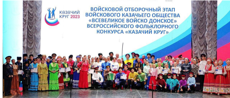
Окончание на 3-й странице.

В Астрахани прошёл войсковой отборочный этап «Все-великого войска Донского» Всероссийского фольклорного конкурса «Казачий круг». Его учредителями являются Совет при Президенте России по делам казачества, постоянная профильная комиссия по содействию развитию казачьей культуры Совета при Президенте РФ по делам казачества и Министерство культуры РФ.